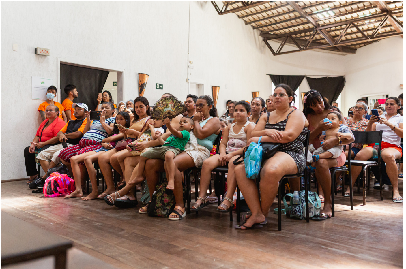
Mostra Coreográfica, em 02/12/2023