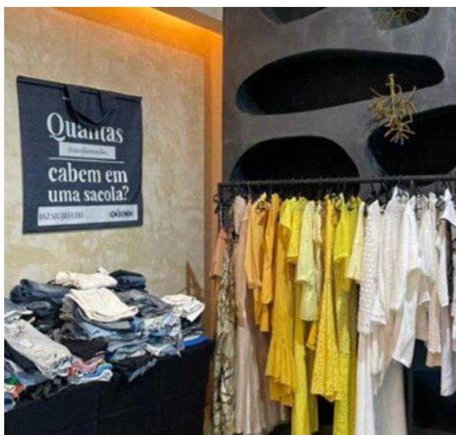
Loja do Bazar & Brechó Edisca, realizado de 6 a 10 de dezembro de 2023

Em dezembro recebemos uma doação no valor de cinquenta mil reais do Instituto Alok, associação que apoia projetos de assistência social, com apoio financeiro e/ou técnico. Este é o segundo ano que recebemos doação do instituto. Confirmado para o Réveillon de Fortaleza, o produtor musical, Alok Achkar, responsável pela fundação do instituto, doou parte de seu cachê para a Edisca.