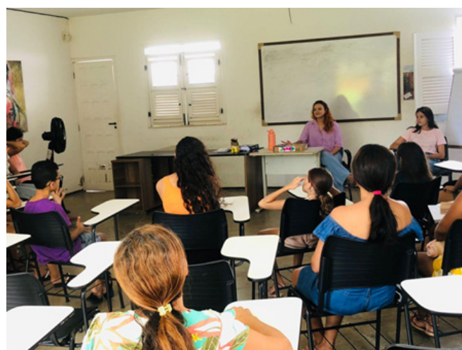
Reunião turno tarde, em 12/2023

Em 15 de dezembro de 2023, realizamos a última reunião anual de bolsistas, contando com a participação de 65 pessoas, entre 35 bolsistas e 30 responsáveis. A iniciativa de reunir educandos e seus responsáveis teve o objetivo de aproximar e ouvir as preocupações dos responsáveis, evidenciando a valorização da oportunidade de estudar em uma escola particular. Muitos destacaram os desafios financeiros, incluindo a aquisição de materiais didáticos, transporte escolar e lanches, expressando emoção e gratidão pela Edisca pelo suporte prestado aos filhos.