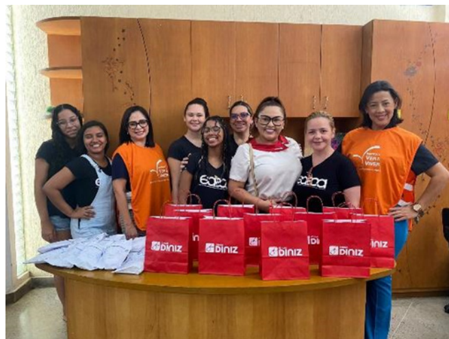
Entrega de óculos de graus a educandos pela Ótica Diniz, em 8/11/23

No dia 8 de novembro a Ótica Diniz, através da parceria com a Fundação Leiria de Andrade, realizou a entrega dos óculos de grau aos educandos contemplados na ação ocorrida no dia 28 de setembro