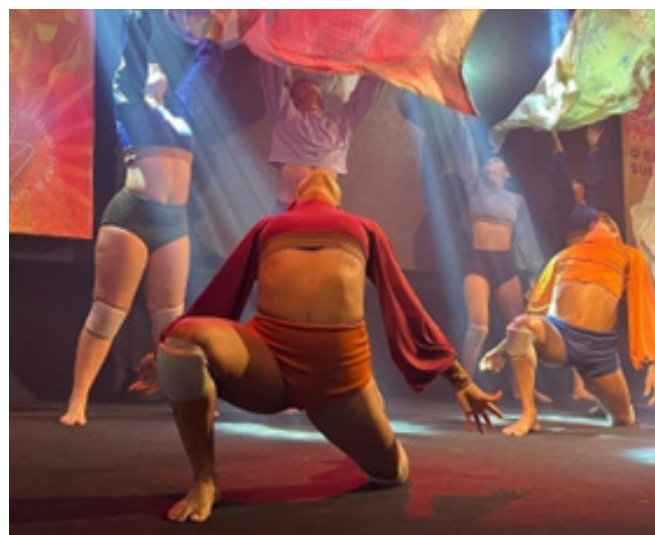
Apresentação Camed, 23/11/2023.

No dia 23 de novembro, apresentamos o balé Periferia, com trilha de 15 minutos, no evento de confraternização e comemoração dos 30 anos da empresa Camed. A apresentação foi destinada aos funcionários, contando com um público de 150 pessoas, e ocorreu no La Maison.