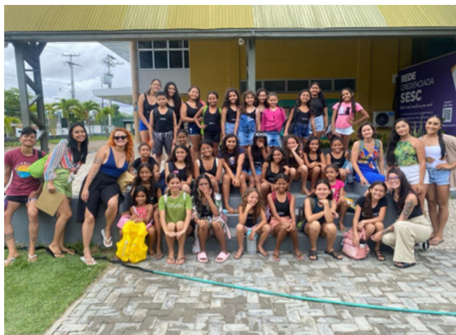
Passeio Sesc Caucaia, em 12/2023

A fim de encerrarmos o ano com otimismo, nossos educandos montaram a própria árvore de Natal, enfeitando com suas próprias palavras tudo que aprenderam durante o ano de 2023, um momento lúdico e de descontração após as avaliações.