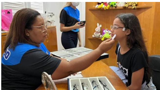
Prova de armações oferecidas pelas Óticas Visão, em 18/11/2023

No dia 18 de novembro, recebemos a equipe das Óticas Visão na nossa instituição, que disponibilizou seu acervo de armações para as crianças, adolescentes e jovens escolherem seus óculos de grau. Nesse atendimento individual, foi levado em consideração o formato do rosto, o tamanho correto dos óculos e a escolha dos educandos. Foram atendidos 31 educandos.