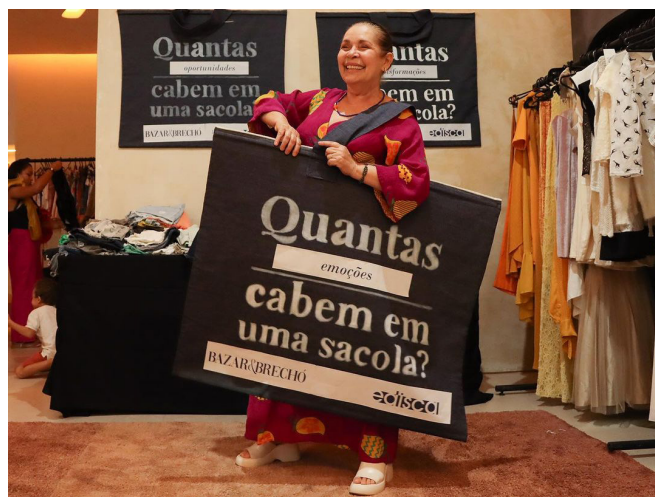
Loja do Bazar & Brechó Edisca, realizado de 6 a 10 de dezembro de 2023