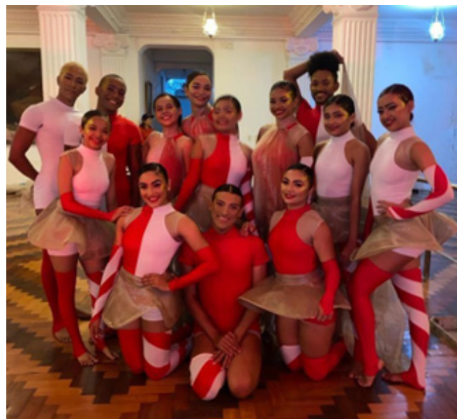
Apresentação Natal de Luz do Ceará, 17/11/2023

Apresentamos o espetáculo em sua versão de 15 minutos para uma plateia numerosa e animada. Após a apresentação, recebemos um feedback positivo do presidente da CDL, que demonstrou imensa felicidade e satisfação em ter assistido o balé, com inúmeros elogios e até futuros convites para os próximos eventos.