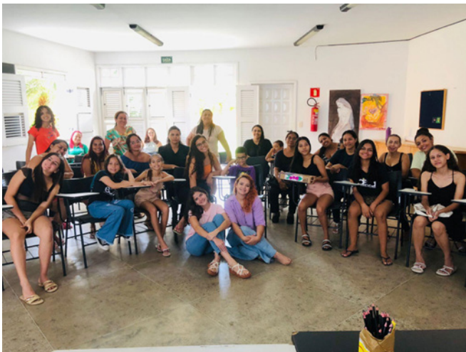
Reunião turno tarde, em 12/2023