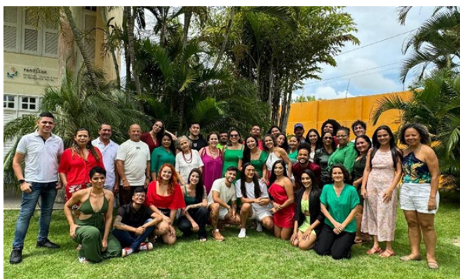
Confraternização Edisca 2023, em 20/12/2023

No dia 20 de dezembro, realizamos nossa confraternização de final de ano com toda a equipe e amigos. Foi um dia de celebrar e reforçar os laços fraternos e de justiça social que nos une.