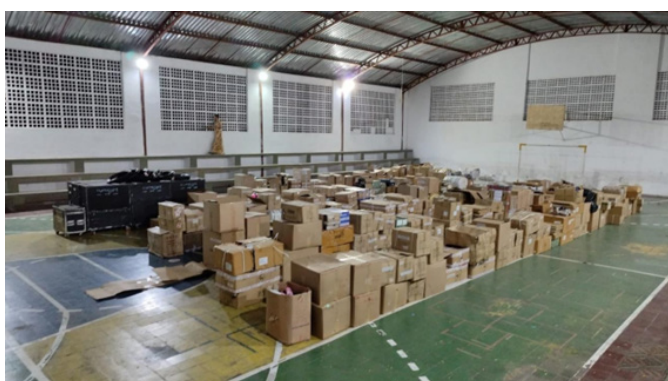
Nova parceria: Colégio Darwin, em 10/2023.

Em novembro, fomos contemplados com uma doação de produtos apreendidos pela Receita Federal. Trata-se de uma ação do órgão que destina mercadorias em posse da Receita para serem vendidas e arrecadar recursos para diversas instituições. O recebimento e comercialização da mercadoria é de responsabilidade da instituição beneficiada. Este ano, a Edisca foi contemplada juntamente com mais três outras instituições para realizar em conjunto o bazar na cidade de Itapipoca – CE. São elas: CNBB – Conferência Nacional dos Bispos do Brasil, Fazenda da Esperança e Casa de Vovó Dedé. A previsão de realização da feira será em janeiro de 2024.