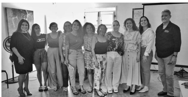
Reunião com Conselho executivo, fiscal e estratégico da Edisca, em 12/12/2023

Em dezembro realizamos um encontro com os conselheiros da instituição para apresentar o resultado das capacitações realizadas ao longo de 2023, em parceria com a Somos Um, organização que busca implementar negócios de impacto para resolução de problemas sociais. Durante o ano, tivemos encontro com a equipe do Futuro das Coisas, Somos Um e Flow Desenvolvimento Integral. Foram apresentados três materiais produzidos nesses encontros: Visão de Futuro, Elementos Culturais da Edisca e Ações de Fortalecimento Institucionais.