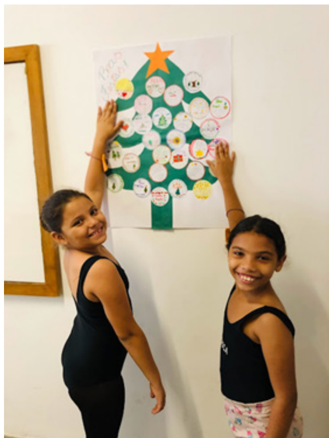
Construção da árvore de natal, em 10/2023