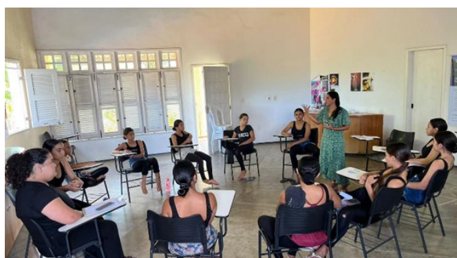
Palestra sobre Passe Livre Estudantil. 29/10/23