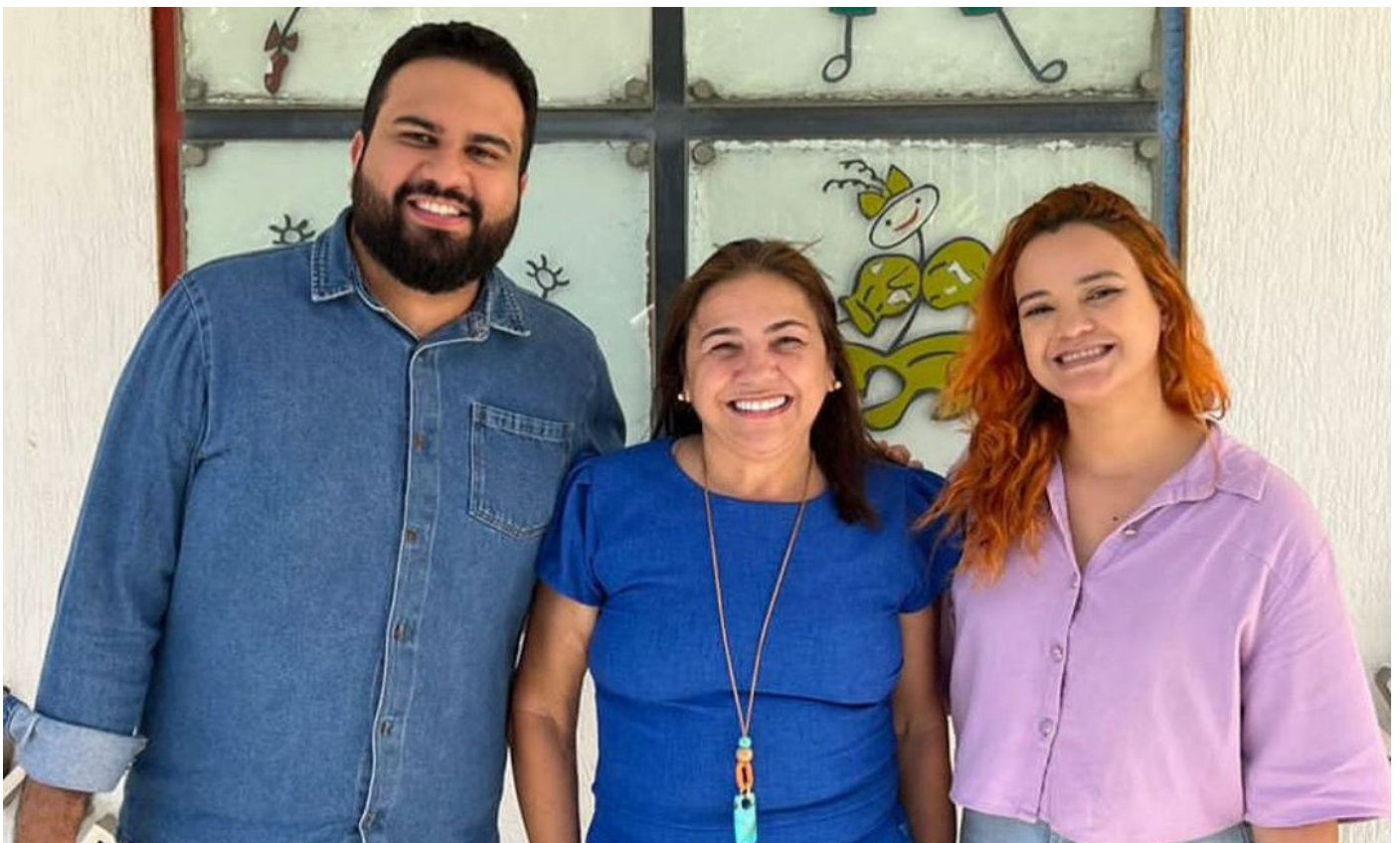
Nova parceria: Colégio Tiradentes, em 10/2023.