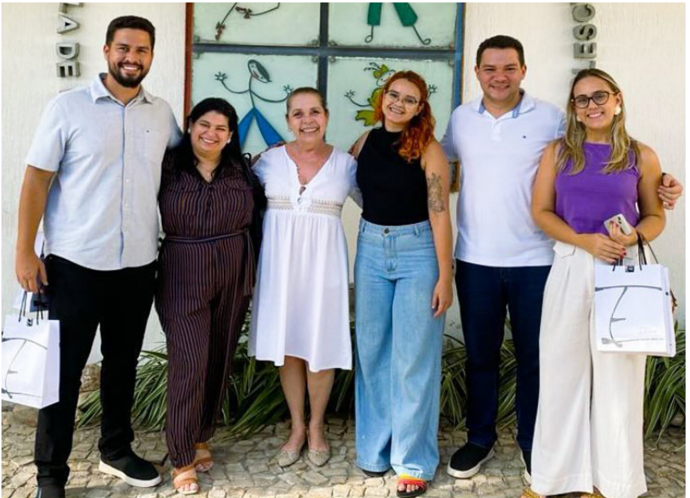
Nova parceria: Colégio Darwin, em 10/2023.