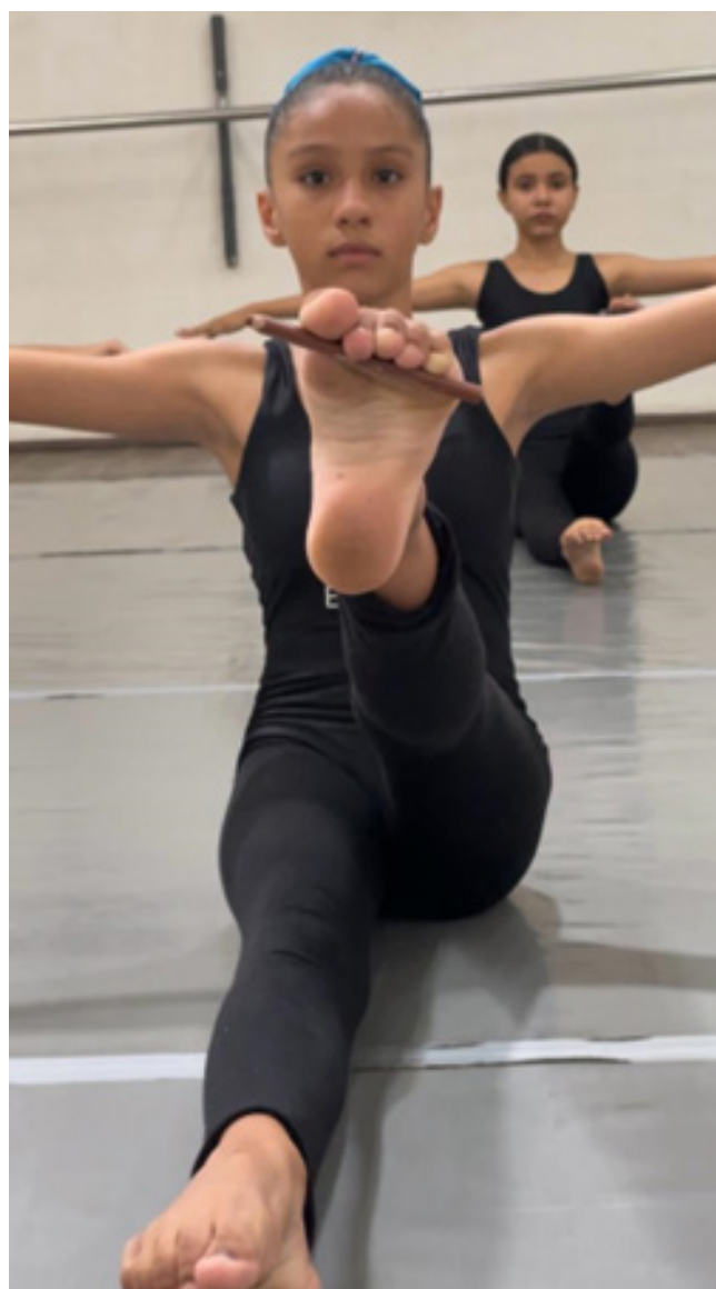
Aula de preparação física para turma INT-2, em 06/10/23