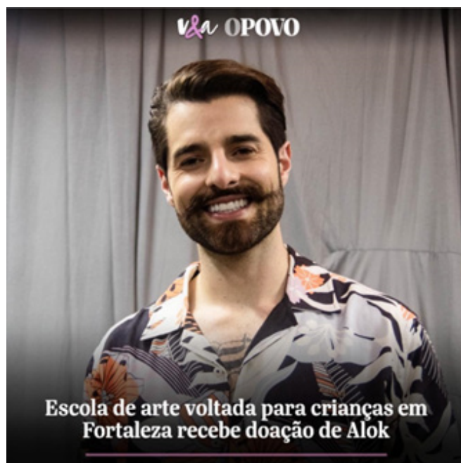
Notícia do caderno Vida e Arte, do jornal O POVO