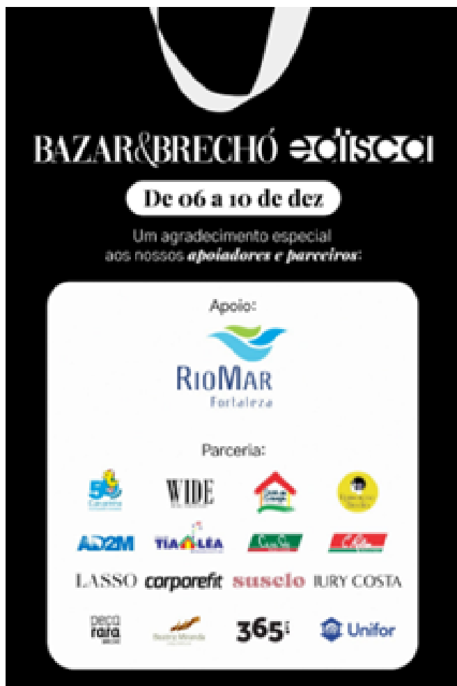
Marcas parceiras do Bazar & Brechó Edisca, realizado de 6 a 10 de dezembro de 2023