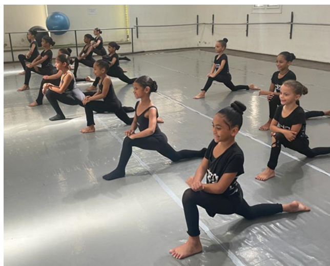
Aula de técnica clássica para turma SQ-10, em 17/10/23

Após a exposição, as educandas puderam tirar diversas dúvidas a respeito do funcionamento e utilização desse direito.