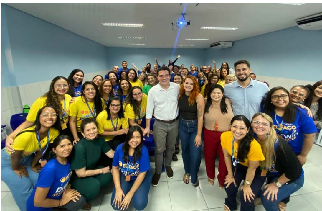
Abertura da Jornada Pedagógica do Colégio Darwin

Novas parcerias foram estabelecidas com os Colégios Tiradentes e Darwin, sendo este último, além de oferecer bolsas integrais, responsável pelo fornecimento de fardamento e material didático completo. A coordenação do programa também participou de encontros para apresentar a importância das parcerias e compartilhar a trajetória da Edisca.